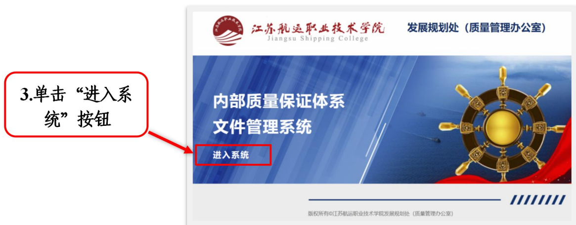
图7 文件管理系统首页