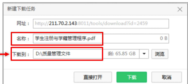
图 14 文件下载界面