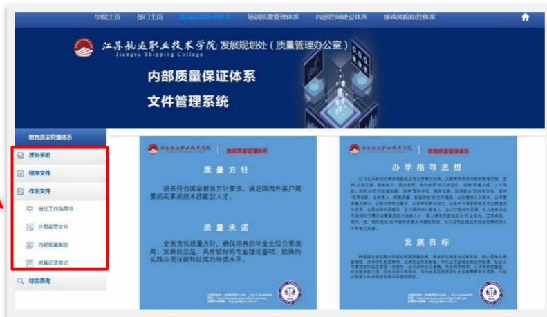
图 11 在左侧列表中选择文件