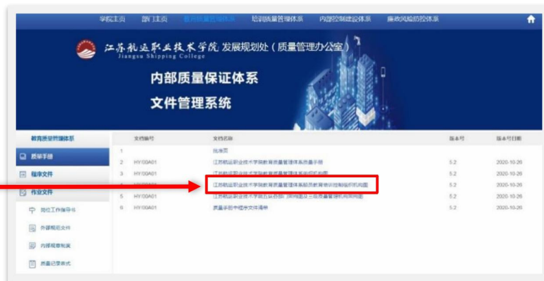
图 12 查阅文件