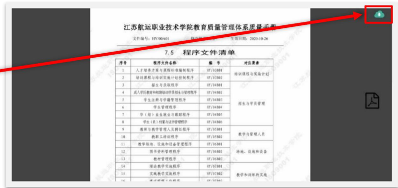
图 13 文件预览界面