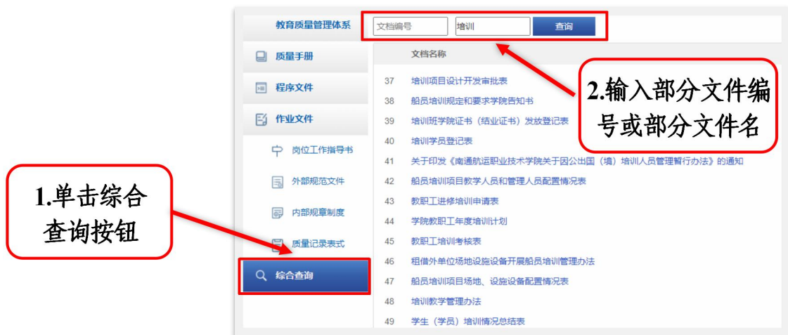
图 20 综合查询方法