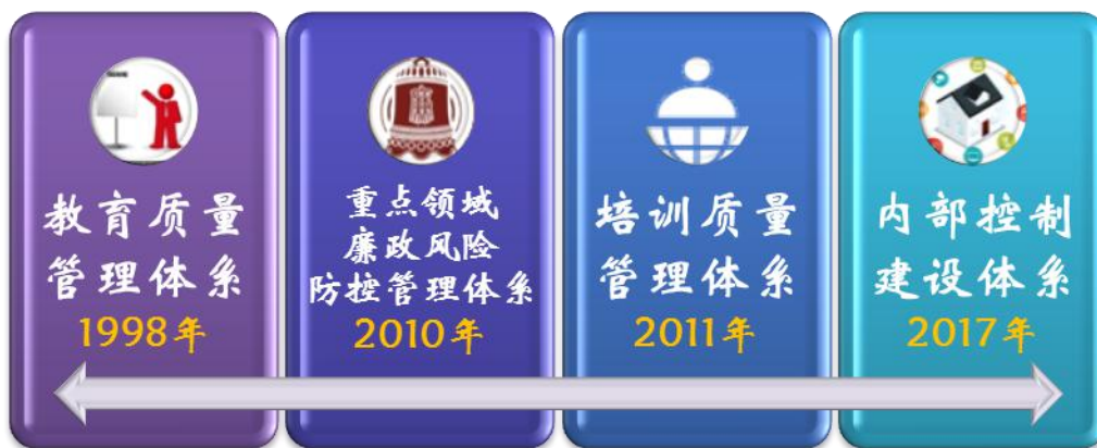
图1 学校内部质量保证体系总体架构示意图

1. 教育质量管理体系简介： 1998年，学校依据ISO9001质量标准、《1978年海员培训、发证和值班标准国际公约》（简称STCW公约）和国家海事法规，建立与运行了船员教育与培训质量管理体系，以对人才培养培训工作进行过程监控，稳定和提高教育教学质量，并于1999年通过了中华人民共和国海事局的质量认证，取得了质量管理体系证书。2005年，学校将质量体系覆盖范围扩展应用至全校行政工作范围内，对影响教育教学质量的各个因素、各个环节实施全面质量监控，体系名称变更为教育质量管理体系。体系文件历经A、B、C、D版本和其间的数次修订。2019年，贯彻教学诊改要求大幅修订改版为5.0版本（如图2所示），将江苏省高职院校内部质量保证体系诊断项目参考表中的6个诊断项目、16个诊断要素、36个诊断点的内涵要求融入到质量体系文件之中，将国家及海事主管机关的最新法律法规要求贯彻到质量体系文件之中，使其同时符合国家教育行政部门和海事主管机关的规范要求，并在投入运行后保持持续改进。目前，体系文件最新版本为5.2版（于2020年10月26日生效运行），文件框架仍然保持质量手册、程序文件、作业文件（包括岗位工作指导书、外部引用的支持性文件、内部规章制度的支持性文件、质量记录表式）三大层次六类文件的基本架构。