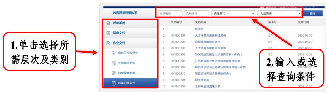
图 19 设置查询条件

单击左侧作业文件→质量记录表式，此时界面右侧分页显示了所有的质量记录表式（约 300 份），在界面上方查询栏中输入或选择相应的条件，可缩小查询范围（如图 19 所示）。如需查询责任部门为教务处的所有质量记录表式，