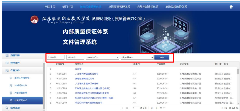
图 18 查询质量记录表式