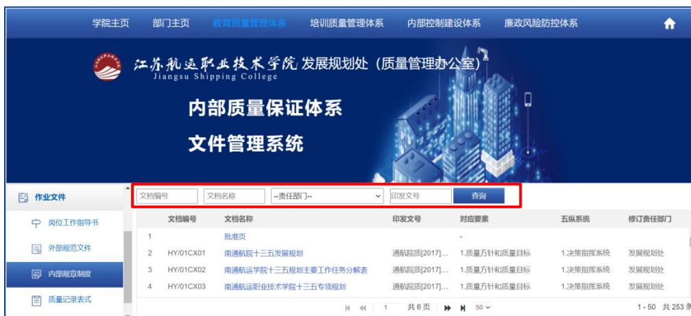
图 17 查询内部规章制度

如图 17 所示，在查询内部规章制度时，可在文档编号、文档名称或印发文号中输入关键字进行查询，也可通过选择责任部门筛选由某一责任部门发文的所有内部规章制度。