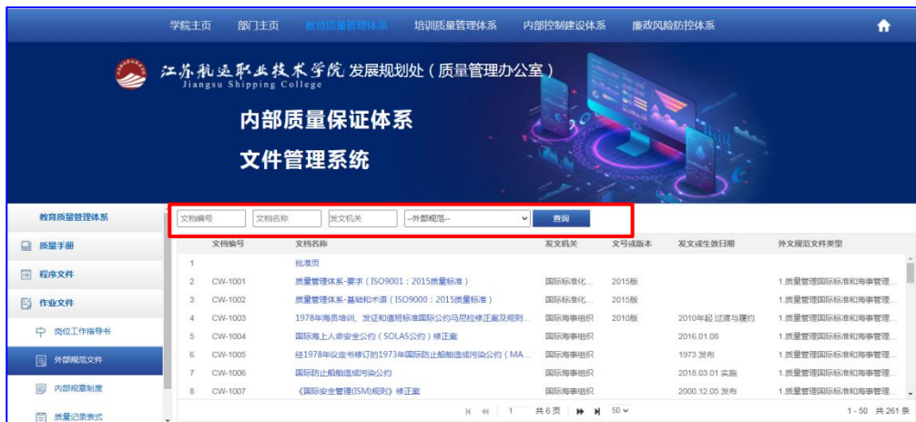
图 16 查询外部规范文件

如图 16 所示，如需查询外部规范文件，可在文档编号、文件名或发文机关中输入关键字进行查询，也可在文件类型中选择文件类别缩小查询范围后进行查询。