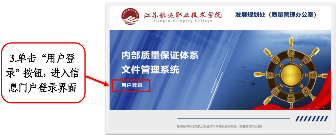
图 9 登录文件管理系统