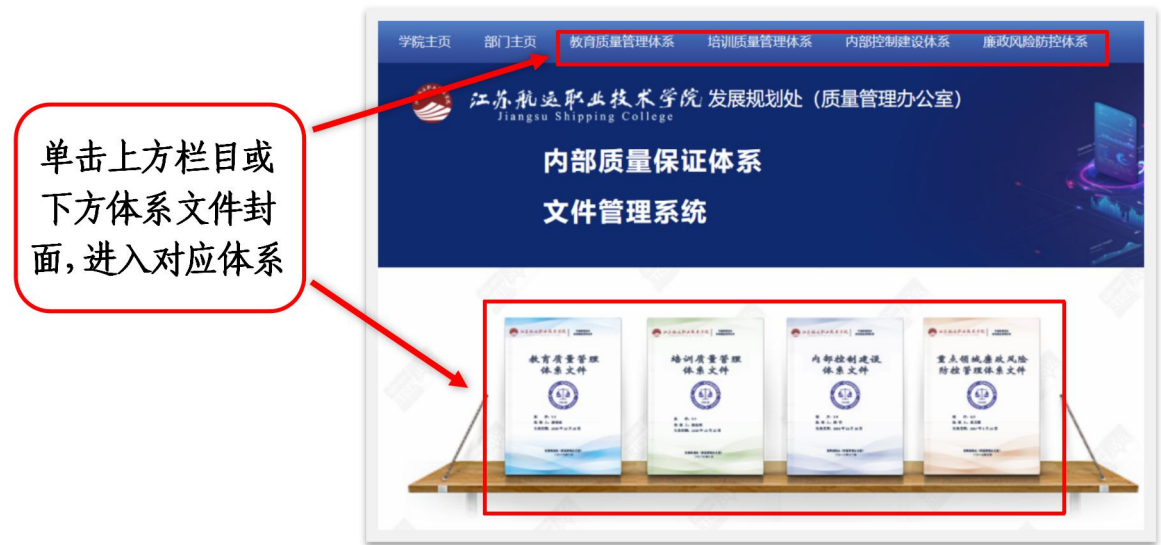
图 10 文件管理系统目录页