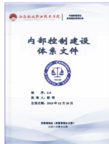
图 5 内部控制建设体系

4. 内部控制建设体系简介： 2016 年，为贯彻落实党的十八届四中全会决定关于强化内部控制管理的有关精神，根据财政部、江苏省财政厅、江苏省交通运输厅、江苏省教育厅关于推进行政事业单位内部控制建设的有关部署要求，保证学校各项经济业务活动合法合规，进一步提高学校内部管理水平与效能，借鉴质量管理原理和工作经验编制了内部控制建设体系（如图 5 所示）文件，覆盖了预决算