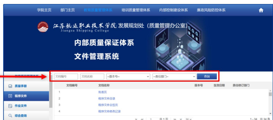
图 15 查询程序文件