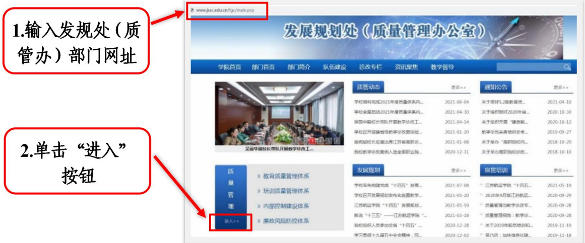
图 8 发规处（质管办）部门首页