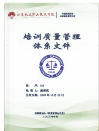
图 4 培训质量管理体系

3. 培训质量管理体系简介： 2011 年，为进一步提高教育与培训质量，增强人才培养与培训工作的国际竞争力，学校通过广泛调研论证，研究确定了参加挪威船级社（DET NORSKE VERITAS，简称 DNV）质量认证的范围、体系名称、受控部门及所属人员组成、工作进程安排等相关事项，组织人员依据 ISO9001 质量标准和 DNV 三大质量规则编写了新的质量体系文件，主要包括质量手册、程序文件、岗位工作指导书、模拟器中心管理手册等一系列文件，